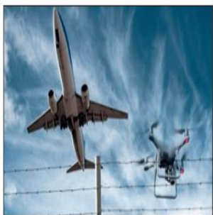
Угрозы БПЛА в мегаполисах связаны с их техническими особенностями и возможной тактикой применения