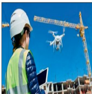
Потребительские дроны являются драйвером развития рынка БПЛА