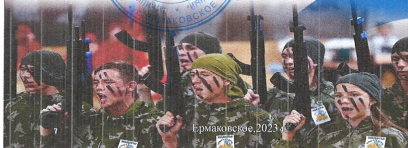
Ермаковское, 2023 г.