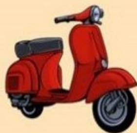
Мопеды, легкие квадрициклы**