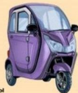
Трициклы и квадрициклы